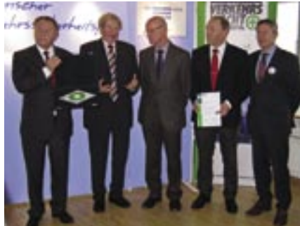
Der 1. Preis geht nach Regensburg

geldern bei Radfahrverstößen an die Verkehrsteilnehmer verteilt. „Das vorbildliche Engagement der Regensburger Verkehrswacht hat im Stadtgebiet zu einer deutlichen Reduzierung der Unfälle mit Radfahrern beigetragen.“ sagte Landespolizeipräsident Waldemar Kindler bei der Preisverleihung.