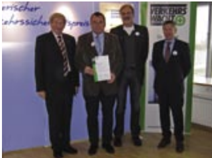
Anerkennungspreis für Donauwörth

Bereits im Jahre 1997 haben die Landesverkehrswacht Bayern e. V. und die Versicherungskammer Bayern den Bayerischen Verkehrssicherheitspreis ins Leben gerufen. 2011 wurden die Sieger zum zehnten Mal in Form eines Wettbewerbs ermittelt und Anfang Dezember im Polizeipräsidium Oberpfalz in Regensburg geehrt. Der erste Preis ging an die Verkehrswacht Regensburg e.V. für die Verkehrssicherheitsaktion „Geisterradler gefährden!“. An unfallträchtigen Standorten im Stadtgebiet wurden