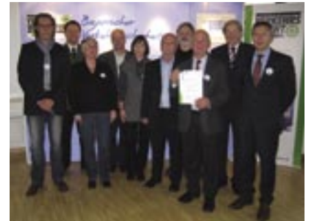
Der 3. Preis geht nach Lichtenfels

Der dritte Preis konnte der Kreisverkehrswacht Lichtenfels e.V. für ihren Film „Geisterfahrer“ überreicht werden. Mit diesem Film wurde das vorrangliche Problem einer alternden Gesellschaft dargestellt, bei dessen Ende es zu einem verhängnisvollen Unfall kommt.